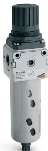
Фильтр-регулятор (изображение может отличаться)

5.2.6. На трубопроводе сжатого воздуха установить фильтр-регулятор с шаровым краном за ним. Место установки фильтра регулятора выбрать таким образом, чтобы к нему был доступ для осуществления настройки и контроля давления сжатого воздуха. На регуляторе выставить давление 6 бар.